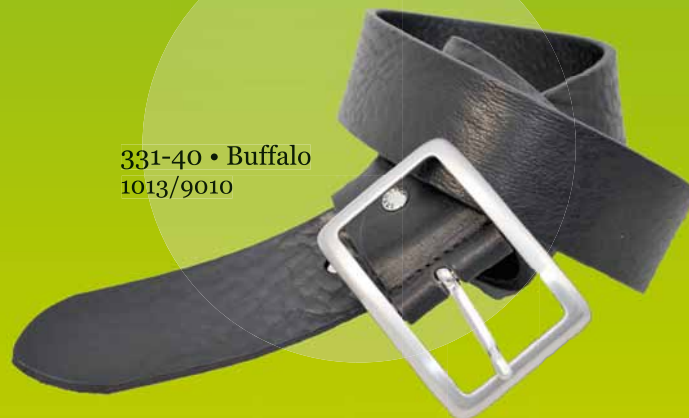
331-40 • Buffalo 1013/9010