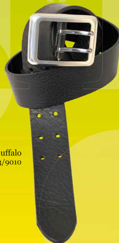
403-40 • Buffalo 1013/9010