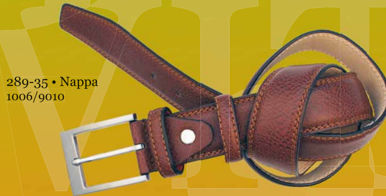
289-35 • Nappa 1006/9010