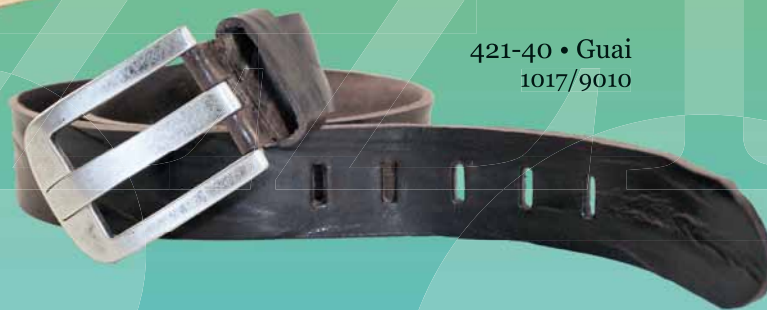
421-40 • Guai 1017/9010