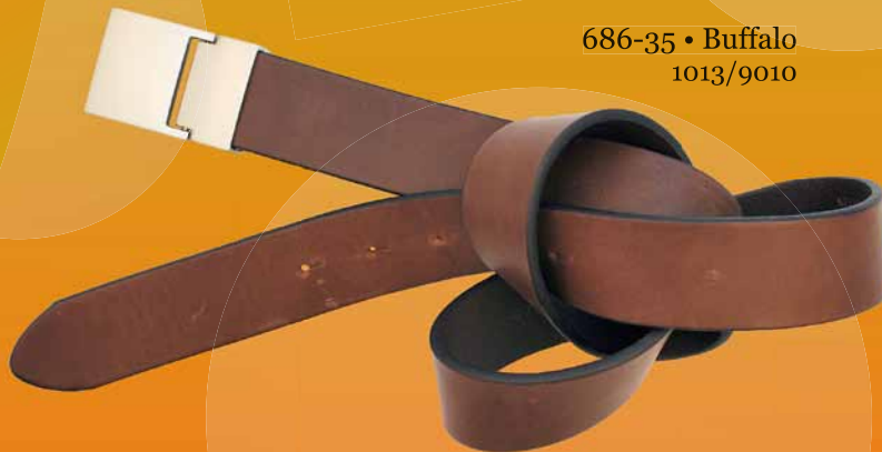
686-35 • Buffalo 1013/9010