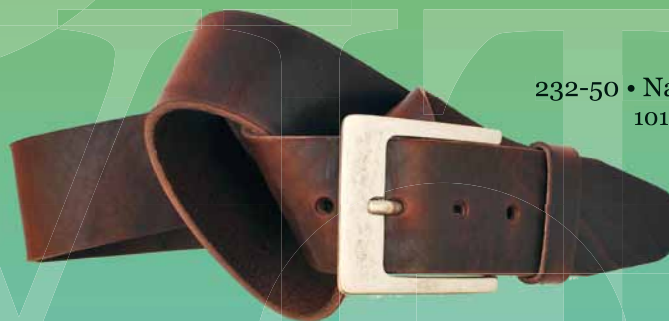
232-50 • Naturale 1015/9010