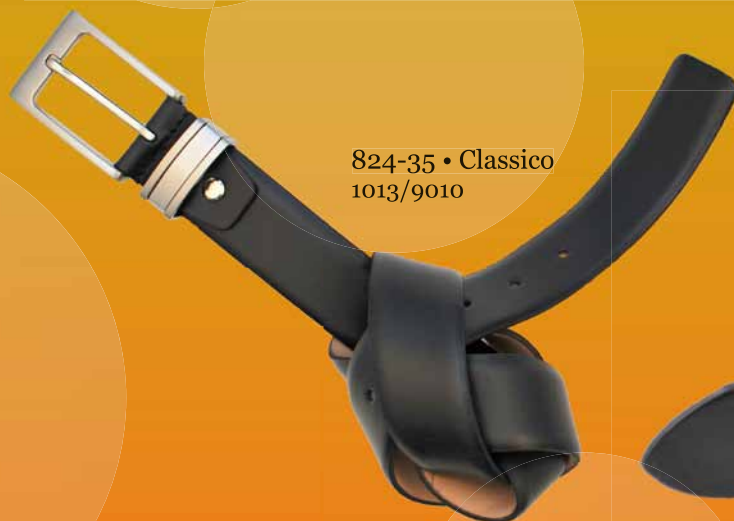
824-35 • Classico 1013/9010