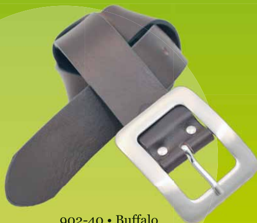
902-40 • Buffalo 1013/9010