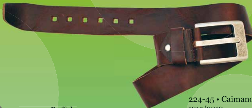
224-45 • Caimano 1015/9010