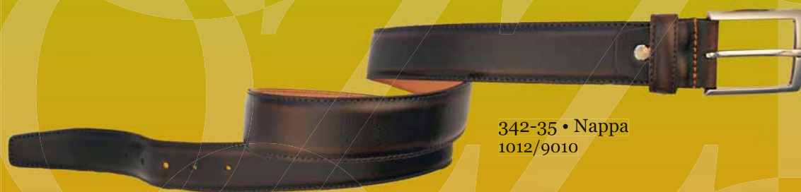
342-35 • Nappa 1012/9010