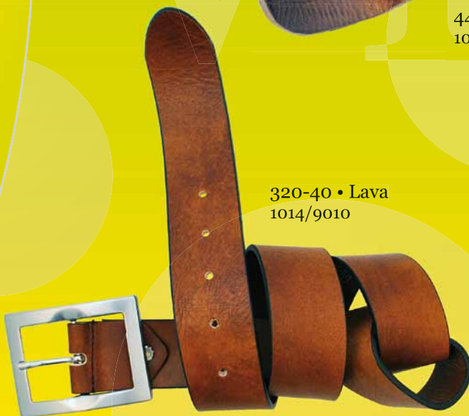
320-40 • Lava 1014/9010