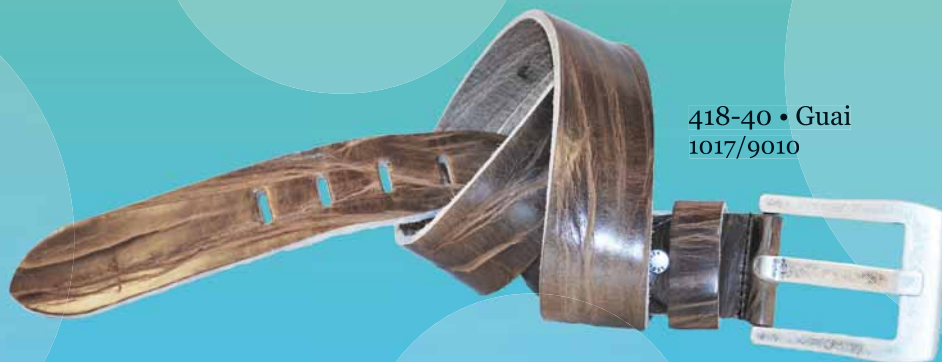
418-40 • Guai 1017/9010