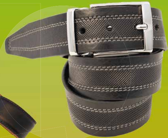
467-40 • Cinto 1015/9010 schw/br