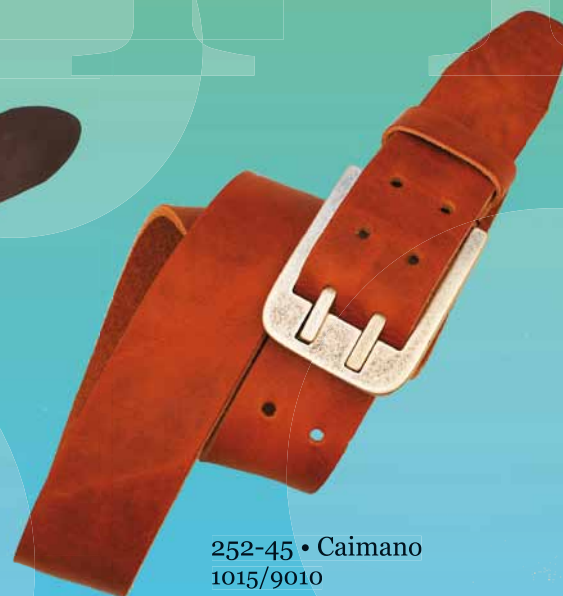
252-45 • Caimano 1015/9010