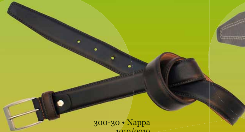
300-30 • Nappa 1010/9010