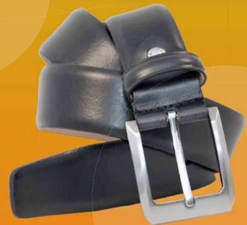
887-35 • Classico 1013/9010