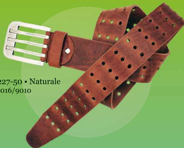
227-50 • Naturale 1016/9010