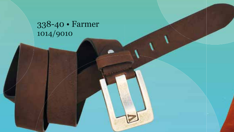
338-40 • Farmer 1014/9010