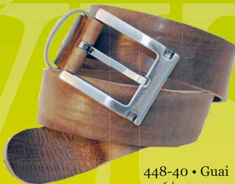
448-40 • Guai 1016/9010