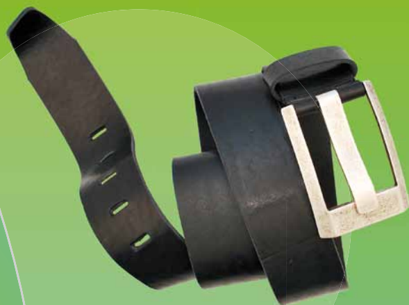
229-45 • Naturale 1014/9010